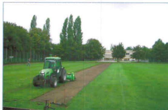
Abtragen des alten Rasenfläche

Der Verein sagt der Stadt Braunschweig Danke für diese nicht selbstverständliche Investition!