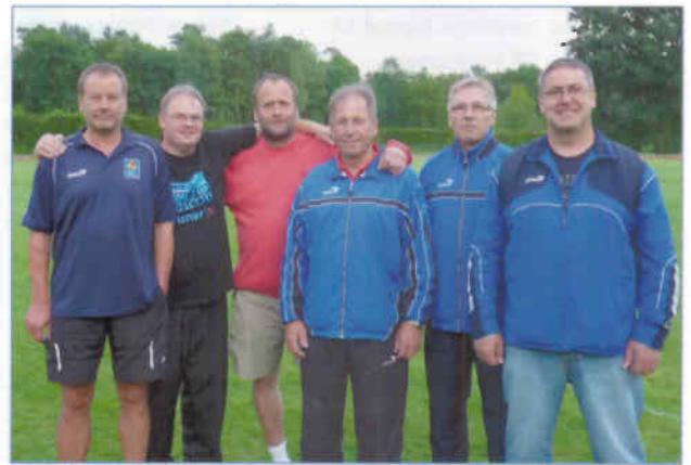
Mit drei prominenten Gastspielern erfolgreich beim Turnier in Uelzen:

Eine tolle Bilanz erzielten die Faustballe der SCE Gliesmarode beim Turnier des TV Uelzen.