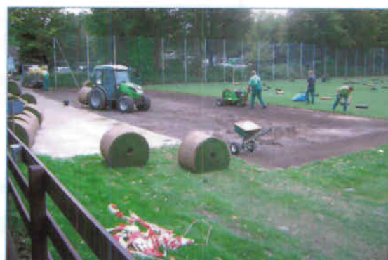
Verlegen des Rollrasens