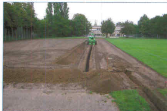
Schächte für die Beregnungsanlage